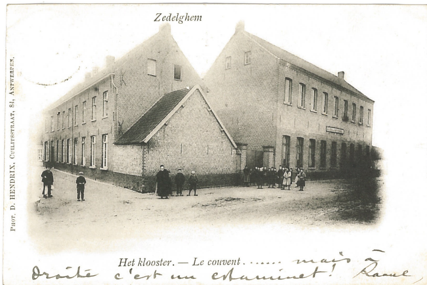
Fig. 13 - Het klooster: "... mais à droite c'est un estaminet! Raoul"