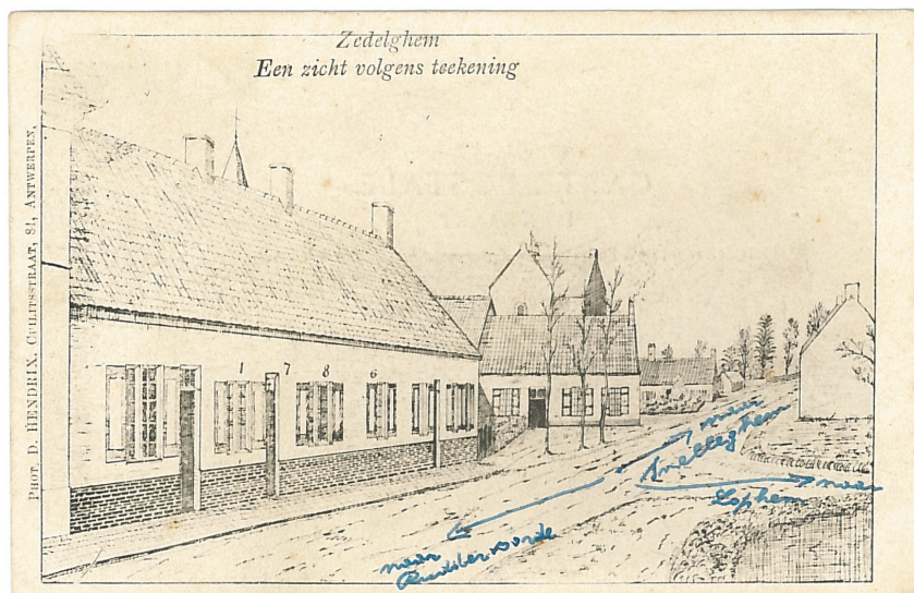
Fig. 18 - Zedelghem. Een zicht volgens teekening (Op dit exemplaar werden jammer genoeg de straatnamen bijgeschreven in blauwe inkt)