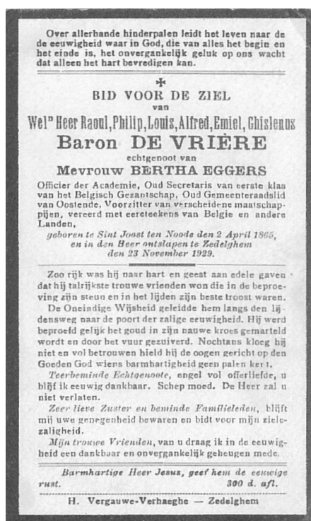
Fig. 3 - Bidprentje van Raoul de Vrière

banden met Zedelgem knipte hij nooit helemaal door. In 1928 kwam hij zelfs officieel terug in Zedelgem wonen, hij overleed er op 23 november 1929, na zich verzoend te hebben met pastoor Ronse, en kreeg er zowaar een katholieke begrafenis.