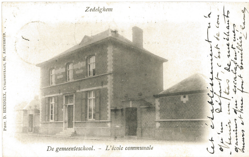
Fig. 14 - De gemeenteschool: "Cet établissement n'a qu'un défaut, c'est de contenir un tas de méchants gamins qui escaladent mes murs en me font bouillir! Raoul"