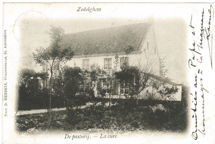
Fig. 16. - De pastorijs: "Amitiés au Papa et hommages à la Maman. Raoul"