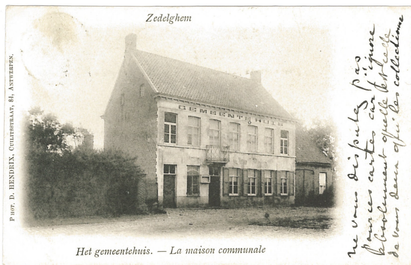
Fig. 15 - Het gemeentehuis: "Ne vous disputez pas pour ces cartes, car j'ignore absolument quelle est celle de vous deux qui les collectionne."