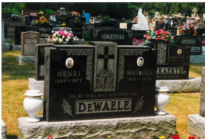
Fig. 3 - Zomaar een foto op het kerkhof van Delhi, Ontario (Canada), met de Vlaamse familienamen Dewaele, Osaer, Rotsaert, Bekaert, Heyndrickx enz.

Helaas, niet iedere emigratie was een successtory. Velen hebben zwarte sneeuw gezien, soms door tegenslag in de zaken, door onderschatting