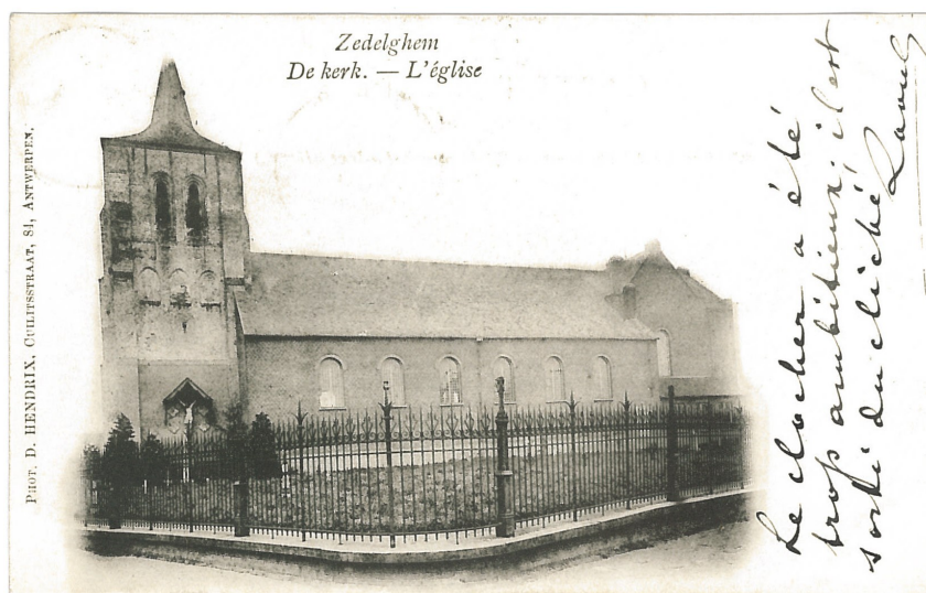
Fig. 10 - De kerk: "Le clocher a été trop ambitieux; il est sorti du cliché. Raoul"