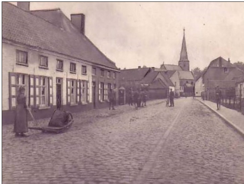
Fig. 2 - Loppem tijdens WO1. Een vrouw brengt een zak kolen op de kruitwagen naar huis, richting dorpskom. Enkele Duitse soldaten slenteren door de Steenbrugsestraat. Rechts van het witte huis zien we de kosterie.