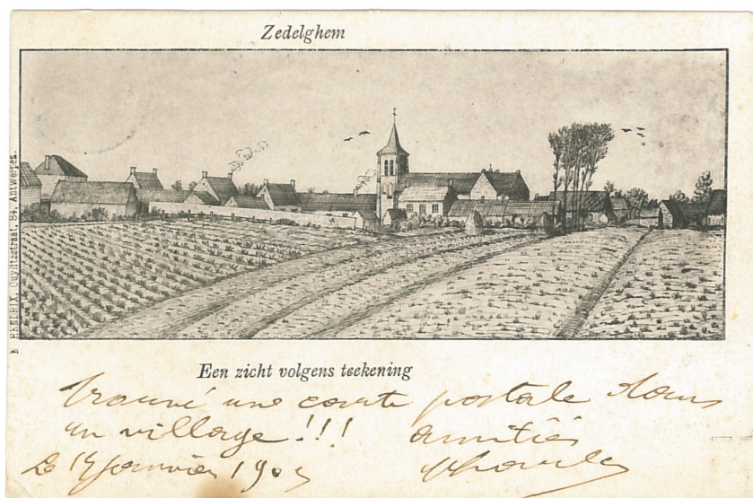
Fig. 19 - Zedelghem. Een zicht volgens teekening: "Trouvé une carte postale dans un village!!! Le 14 janvier 1903. Amitiés, Raoul"