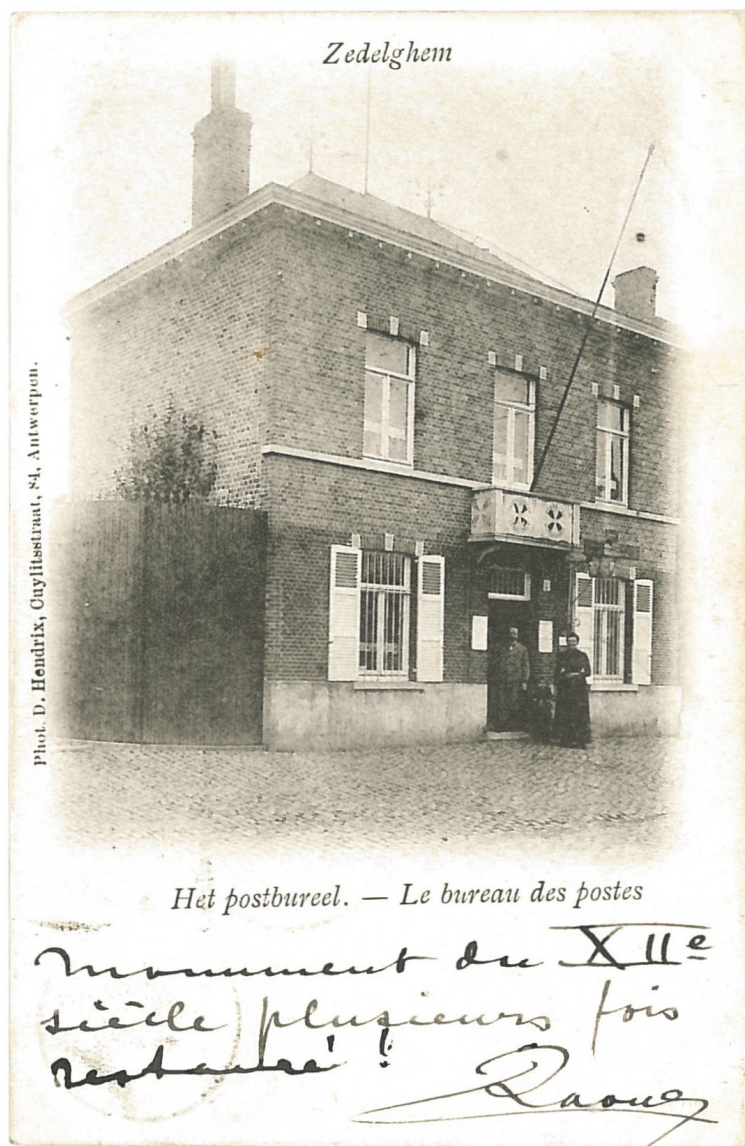
Fig. 12 - Het postbureel, met foutieve commentaar: "Monument du XIII e siècle plusieurs fois restauré! Raoul"