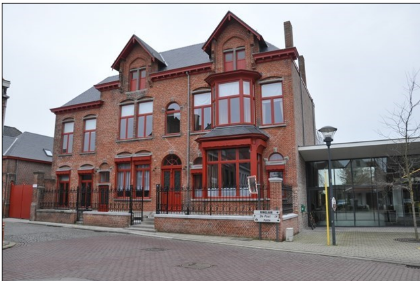
Fig. 1 - Het huis Proot in Koekelare

De welstellende boerenzoon, mijnheer dokter, had daarvoor architect Oscar De Breuck onder de arm genomen. Een kast van een huis met rijkelijk interieur aan de rand van het marktplein was het resultaat van hun samenwerking.