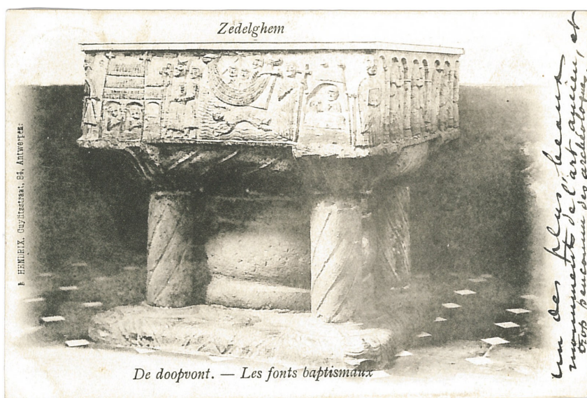
Fig. 11 - De doopvont: "Un des plus beaux monuments de l'art ancien, et trop peu connu des archéologues."