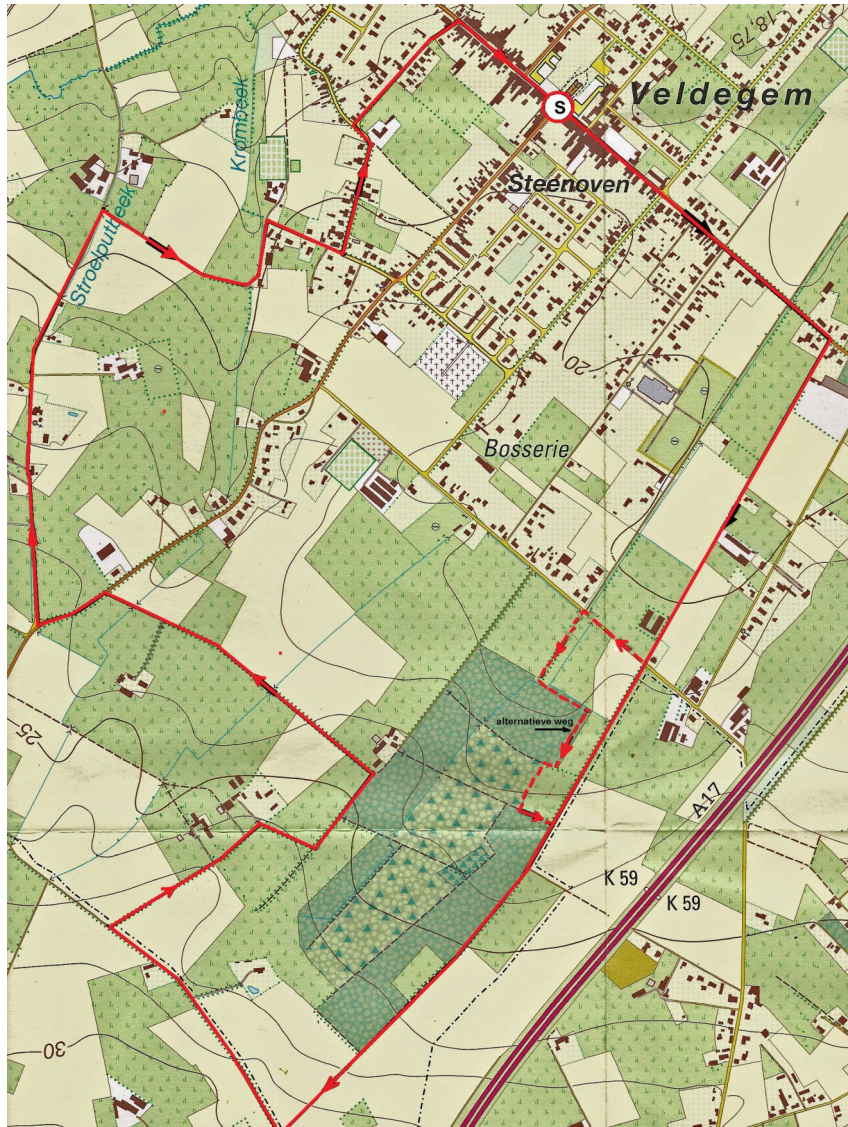
Fig. 1. Krakkepad