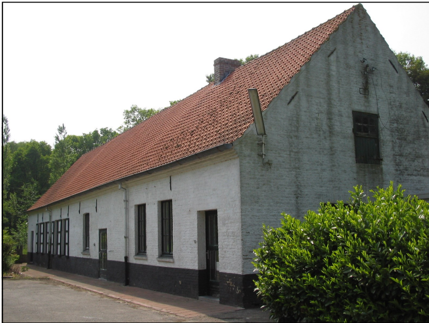
Fig. 2. Hoeve genaamd 'Ferme Bocca' in het Vloethemveld