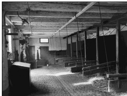
Fig. 4. Stallingen van herberg De Roode Poort