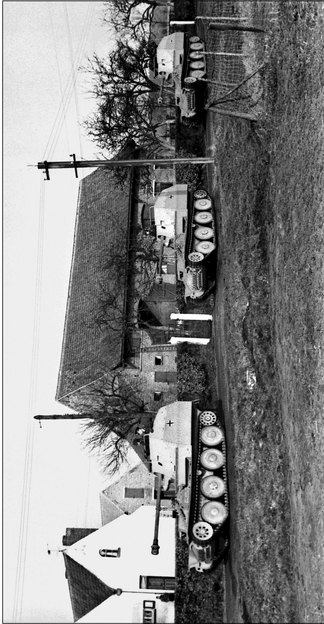
Fig. 3. Drie Marder III-tankjagers, met 7,5 cm antitankgeschut, rijden langs de Diksmuidse Heirweg, ter hoogte van de hoeve Noortwege.