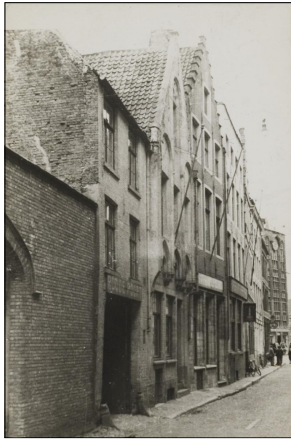
Fig. 3. Herberg-afspanning De Roode Poort, en rechts ervan herberg De Gouden Ster (met trapgevel), in de Hallestraat te Brugge

En hoe verliep het met onze evers? Wat allicht niemand verwachtte, gebeurde toch. Ze kwamen vanaf 2005 terug.