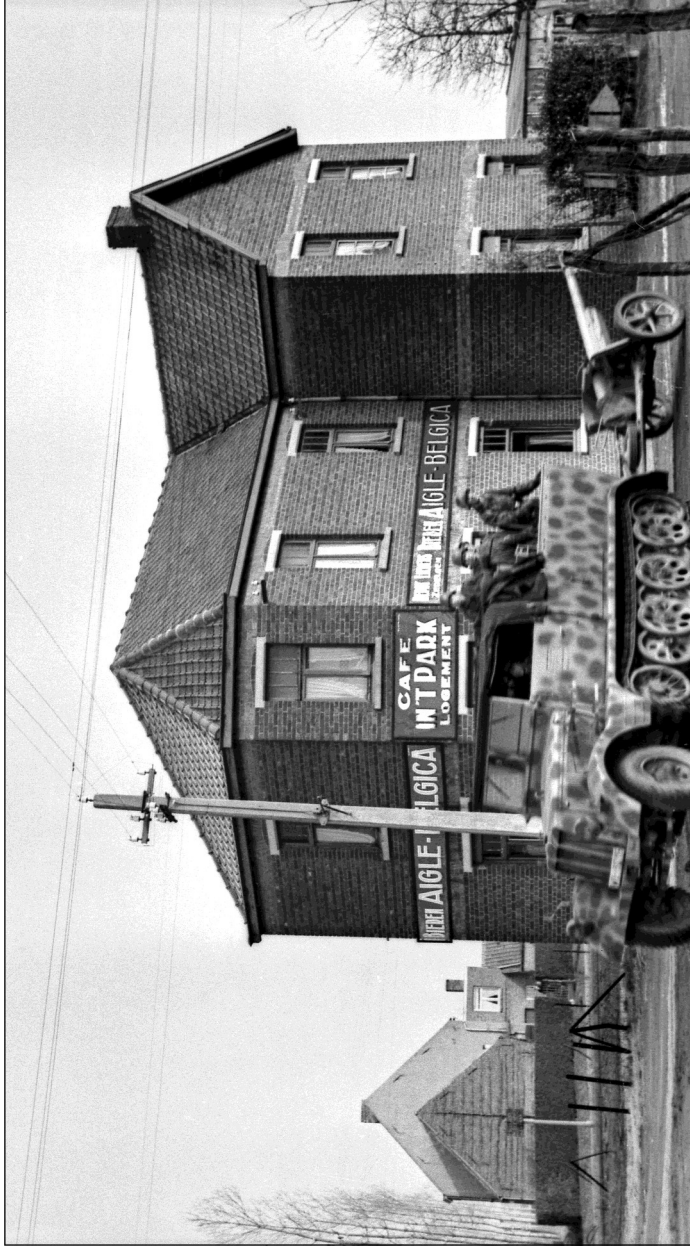
Fig. 2. Halfvoertuig met vierkoppige bemanning in de halfopen laadbak en met 7,5 cm antitankkanon rijdt langs Café In 't Park, op de hoek van de Kronestraat en de Diksmuidse Heirweg, onderweg naar de kazerne Kapitein Stevens.