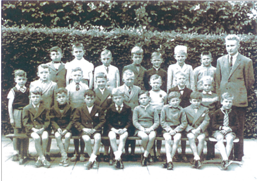
Fig. 3. Klasfoto van het eerste leerjaar 1955-1956.