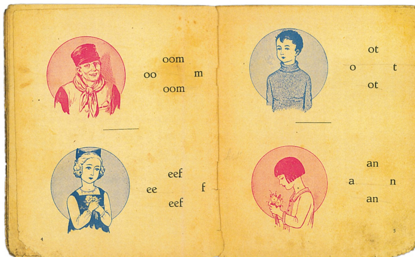
Fig. 2. Leren lezen met an, ot, eef en oom

gemakkelijk drieletterwoord. Eef was de puber, wat slonzig gekleed in een kleeft tot over haar knieën. Ot was simpelweg een jongetje zoals er wel dertien in een dozijn gaan, net als an, maar dat was uiteraard een meisje. Ot en an moeten ongeveer dezelfde leeftijd hebben gehad, wat jonger dan eef. Of en welke familieband er tussen die vier bestond is ons nooit duidelijk gemaakt. Oom (nonkel) moet in ieder geval familie zijn geweest van minstens één van de drie kinderen. Ik weet evenmin of hij gehuwd was. In ieder geval was hij boer. Dat bleek al na enkele lesjes toen hij met een ladder op de mijt kroop. Een mijt is een bouwsel van stro of hooi. Oom en zijn mijt bezorgden me ooit bijna een oorveeg...’s Middags kwam ik thuis en enthousiast vertelde ik, zoals altijd trouwens, dat we weer iets nieuws hadden geleerd. Ik zei dat we hadden geleerd van: “oom zit op de mijt”. Moeder had begrepen: “Oom zit op de meid!” Ze vermaande me dat ik geen vuile manieren meer mocht vertellen.