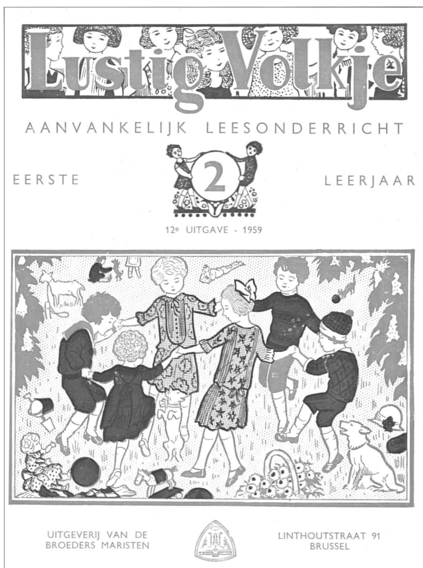
Fig. 1. 'Lustig Volkje': leesmethode voor het eerste leerjaar