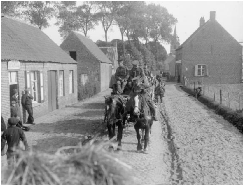
Fig. 8. De Zevende Infanteriedivisie te Jabbeke, 8 oktober 1914

Van de Derde Cavaleriedivisie, die op donderdag 8 oktober 1914 te Oostende en voor een deeltje ook te Zeebrugge ontscheepte, maakte ook het Eerste Life Guards Regiment deel uit.