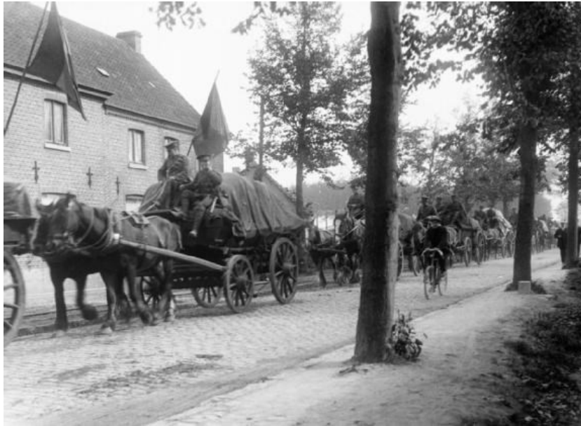
Fig. 7. De Zevende Infanteriedivisie op weg naar Oostende, 8 oktober 1914

aangekomen Zevende Infanteriedivisie dus nu naar Oostende moest, waar ze een verdedigingsgordel aanlegden op een zestal kilometer van de stad.