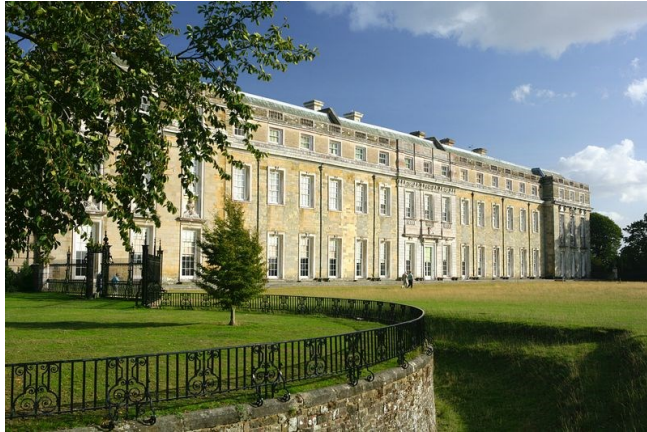
Fig. 13. Petworth House