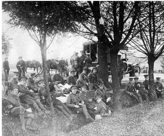
Fig. 10. Het Eerste South Staffordshire Regiment in Gent op 10 oktober 1914

eenheden van de Derde Cavaleriedivisie werden ingekwartierd.