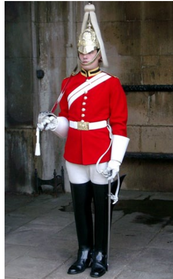
Fig. 9. Uniform van het Eerste Life Guards Regiment

Het te Zeebrugge aangekomen gedeelte van het Eerste Life Guards kwam later op de dag vast te zitten te Blankenberge, waar het door de bevolking allerhartelijkst werd onthaald met sigaretten, koeken en drank. Dit ontwrichtte de troepenbewegingen, waardoor dit deel van het Eerste Life Guards ook te Blankenberge moest overnachten.