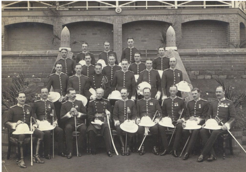
Fig. 2. Het Eerste South Staffordshire Regiment in Pietermaritzburg, 1918

was van Aughnagaddy House in Ramelton in Noord-Ierland. Ovens had reeds jaren overzee (vooral in India) gediend alvorens hij in 1913 bevorderd werd tot luitenant-kolonel, en het bevel kreeg over het eerste bataljon van het South Staffordshire Regiment.