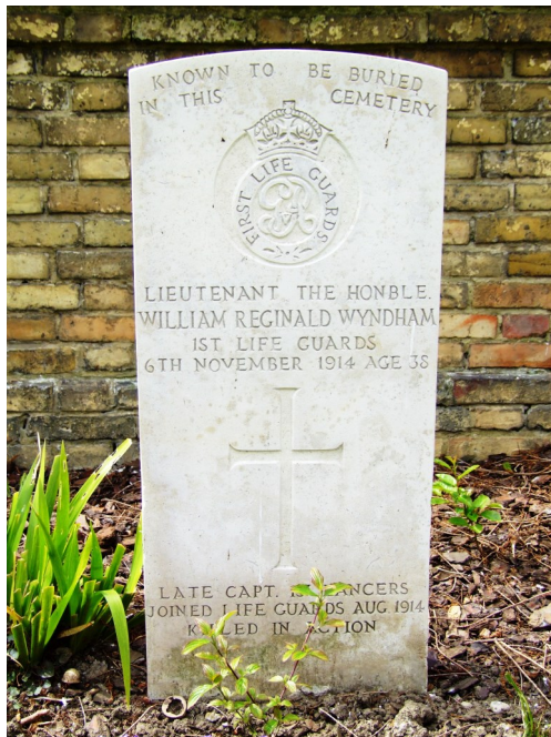
Fig. 18. Grafmonument van W.R. Wyndham op de begraafplaats van Zillebeke

George Archer-Shee werd tweede luitenant en sneuvelde op 31 oktober 1914 in de eerste Slag bij Ieper. De neef van zijn vroegere advocaat was vier dagen vroeger ook reeds gesneuveld in dezelfde Slag.