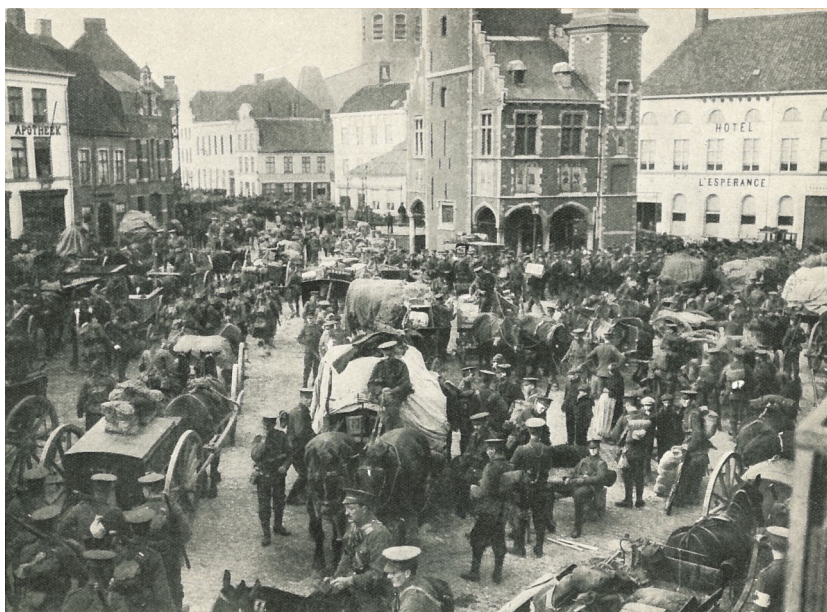
Fig. 14. De Zevende Infanteriedivisie te Tielst op 13 oktober 1914