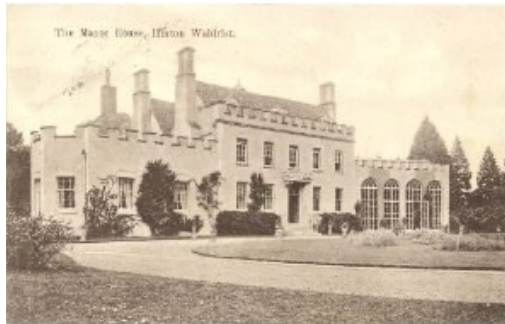
Fig. 6. Landhuis van de familie Loder-Symonds in Hinton Waldrist