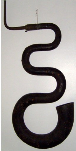
Fig. 6. Serpent russe