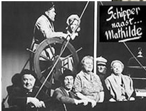
Fig. 3-4. Scènes uit Schipper naast Mathilde

financiële toestand van mijn ouders op de voet volgen... De uitgaven overtroffen wel niet de inkomsten, maar de maandelijkse groei was toch eerder matig.