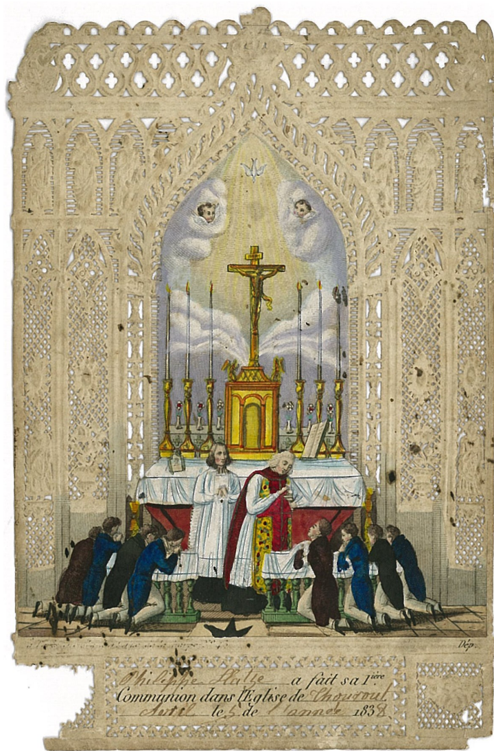
Fig. 2. Communieprentje van Philippe Hatse, 5 april 1838, afgebeeld op ware grootte