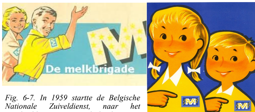
Fig. 6-7. In 1959 startte de Belgische Nationale Zuiveldienst, naar het voorbeeld van Nederland, een reclamecampagne om de jeugd aan te zetten tot het drinken van melk. Nonkel Bob werd het gezicht van de campagne.

Het enige alternatief was dan de Franse zender. Het nadeel was dan weer dat mijn vader geen jota Frans begreep, moeder een heel klein beetje. Voordeel was dat de Franse zender wel eens een vleugje erotiek durfde te vertonen. De films die niet voor kinderen waren bestemd, werden in de rechteronderhoek voorzien van een klein wit vierkantje. Het had een omgekeerd effect, want het was tevens een signaal dat er wat interessants te zien zou zijn. Thuis wisten we alvast hoe laat het dan was bij een klein wit vierkantje in de rechteronderhoek: tijd om naar bed te gaan. Ik heb er wél voor het eerst echte blote borsten gezien, zijdelings maar.