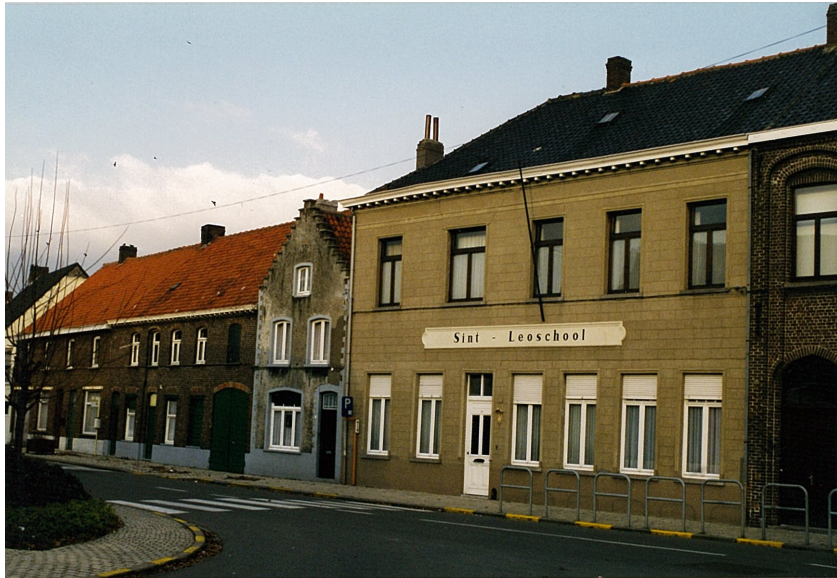
Fig. 5. Hates kasteel, verbouwd tot woonhuis van de Broeders Xaverianen