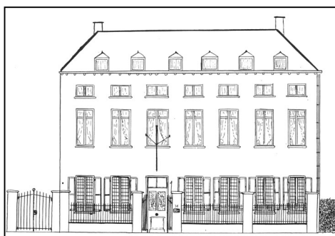
Fig. 4. 'Hatses kasteel' vóór 1905

het landbouwgereedschap, de mestputten, de vijvers met zeldzame vissoorten getuigen van zin voor duurzame en zelfbedruipende ondernemingszin. Naast het gezin, stonden in 1846 op hetzelfde adres nog ingeschreven: Joanna Hatse (halfzus van de