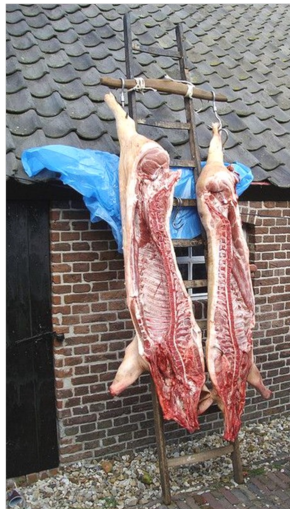
Fig. 2. Zwijnenladder

Daarna werd het opgehangen aan een (korte) ladder, aan een zogenaamde