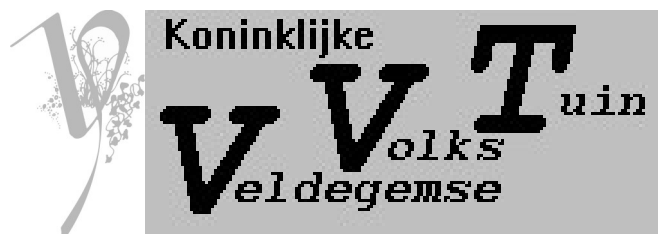
Fig. 1. Logo van de V.V.T.