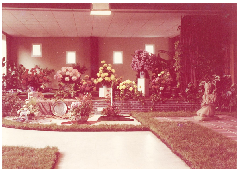
Fig. 11. Tentoonstelling van de Tuinbouwbond in 't Lokaal in 1963

In deze periode werd ook het eerste vrouwelijke bestuurslid, Mej. Magdalena Moeyaert, in het bestuur opgenomen. Dit was voor die tijd zeer vooruitstrevend! Het bestuur zag er dan zo uit: