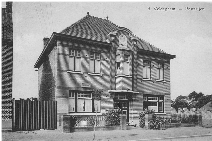
Fig. 2. De posterijen te Veldegem, tevens woonhuis van Petrus Deblauwe

kleinveeteelt was in die tijd een hobby van de burgerij - aan de nodige informatie.