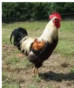
Fig. 3-4. Goldleghorn (links) en Sussex (rechts)

Na verloop van tijd voegden zich bij bovenvermeld tweetal ook nog Camiel Develter 6 , Camiel Vandierendonck 7 , Camiel