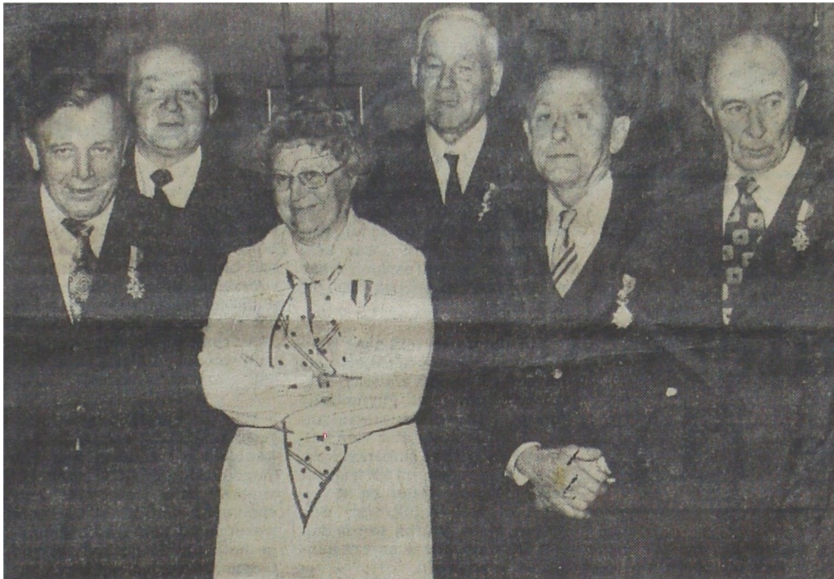
Fig. 13. De verdienstelijke bestuursleden van het Werk der Volkstuinen kregen ter gelegenheid van de jubileumviering het landbouwereteken opgespeld