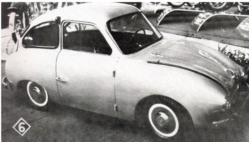
Fig. 1. Prototype van de Flandria-auto op het autosalon van 1955

Informatie hierover is bijzonder schaars. In het boek De geschiedenis van de Belgische auto (uitgeverij Lannoo) wordt de wagen vermeld, samen met een foto. Ook Jan Puype schrijft in zijn boek De ridders van de West-Vlaamse tafel dat “nog in