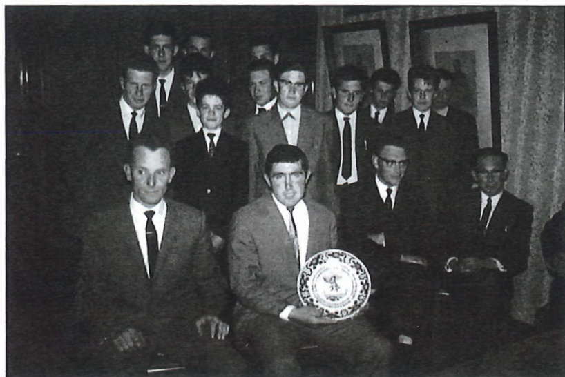
Viering laureaten vendelen, ontvangst op het gemeentehuis