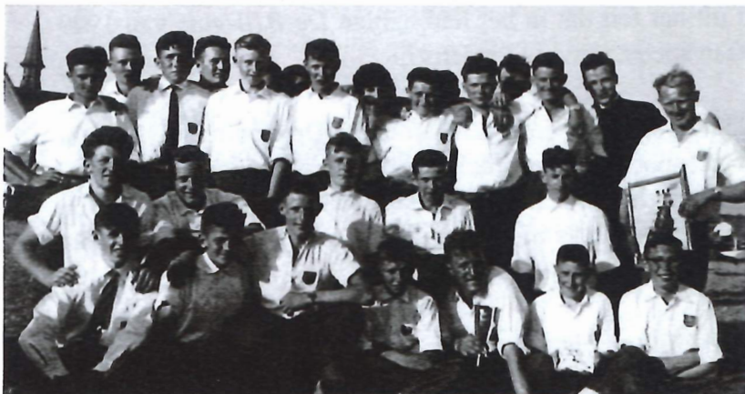
Winnende ploeg op het eerste sportfeest in 1959

De BJB van Aartrijke behaalde een schitterende eerste plaats.