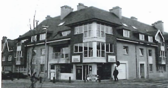
Fig.3 Huidig uitzicht van het T-kruispunt Remberstraat-Koningin Astridstraat.