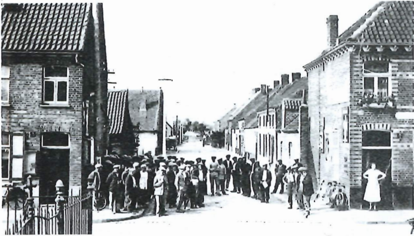
Fig.1 Zijdelingse kijk op de huizen G 7 en 8 in de Koningin Astridstraat, met ernaast 'Moddes reke'. De kaart kreeg verkeerdelijk de titel 'Pastorie'.