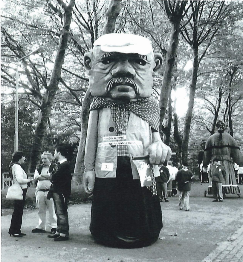
Fig.2 Pier Pette, mascotte van het Zingend Vuurgeboomte.

Verschillende mensen hielpen mee om de reus, die 3 meter 91 cm hoog is, te vervaardigen. Erik Neyt maakte het stevige geraamte. Karel Dupon, een beeldhouwer uit Sint-Andries, gaf de expressieve reuzenkop vorm. De kop werd gemaakt uit een grote blok piepschuim