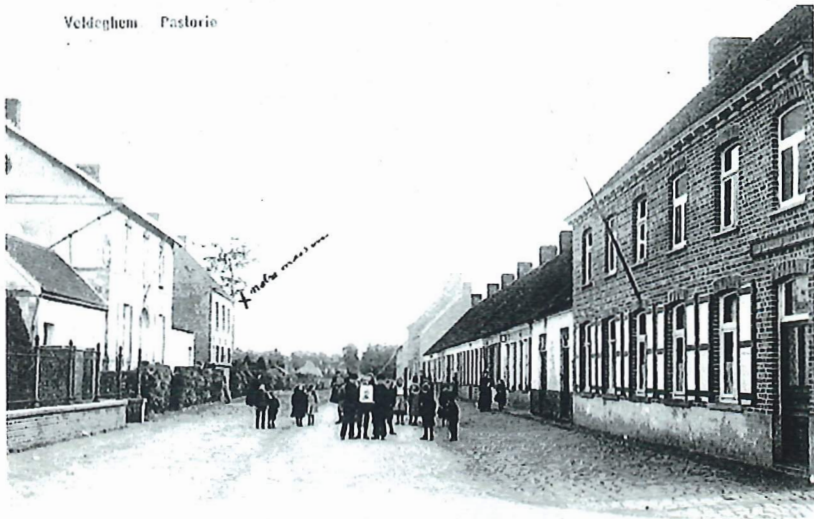
Fig.2 Inkijk in de huidige Rembertstraat met links de herberg 'Gemeentehuis' en rechts het 'Gildenhuis'. Ernaast zijn nog enkele huisjes van de 'Lange reke' in oorspronkelijke toestand zichtbaar. De werklozen wachten op hun stempel.