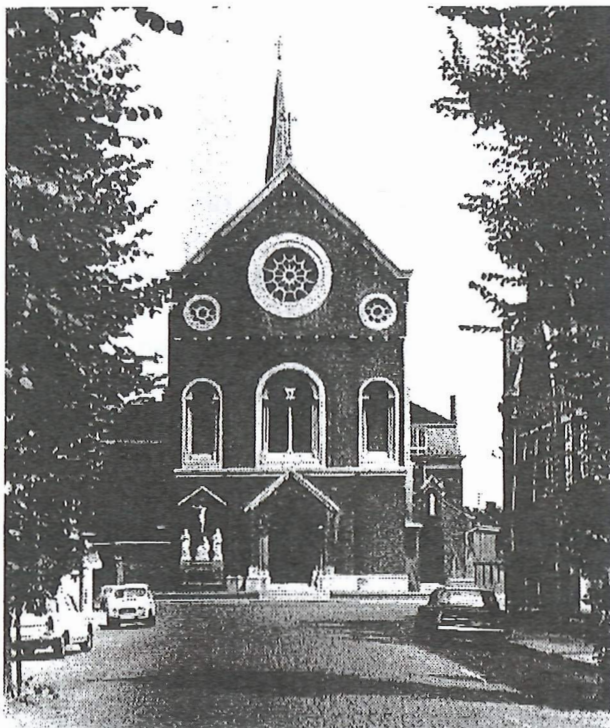
Kerk van de Paters Capucijnen in de Clarastraat (foto V.D. 1966)

Victor Decuninck Xaverianenstraat 1 8200 Sint-Michiels Brugge