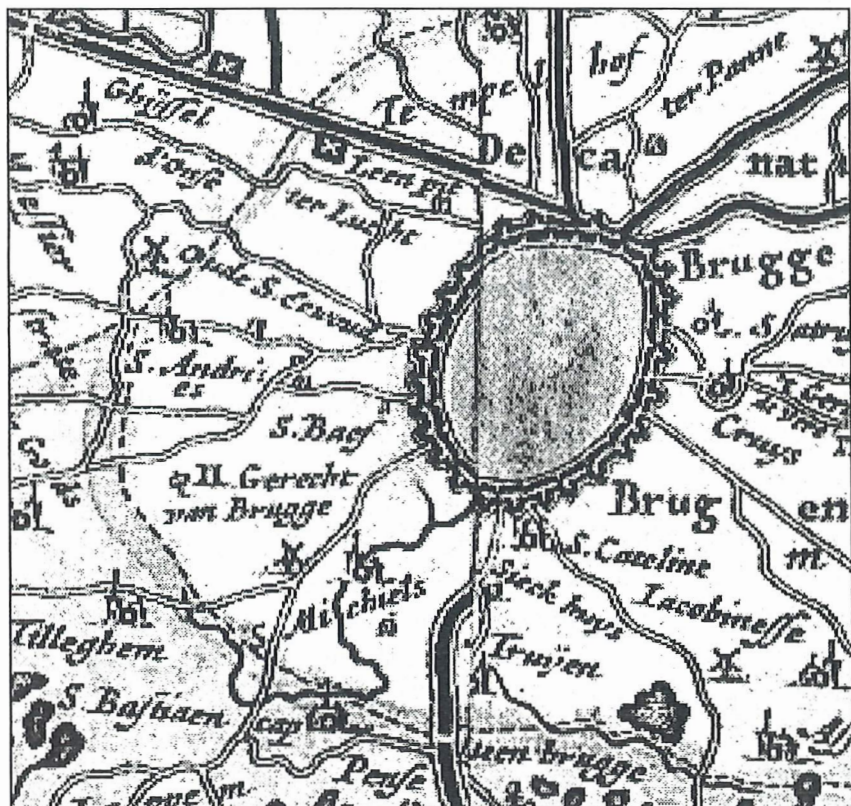
Gerecht van Brugge - detail uit de kaart van Joan Blaeu. (Jozef Bossu: Vlaanderen in oude kaarten)