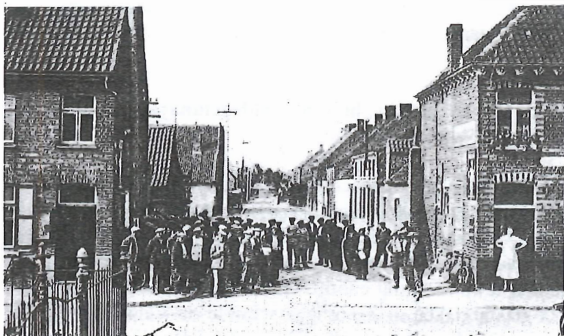
Talrijke Veldegemse werklozen bij het gemeentehuis in de jaren dertig.

Omdat het aantal werklozen kort daarop schrikbarende afmetingen aannam, besliste de gemeentelijke overheid in oktober 1931 een commissie aan te stellen ter opsporing van misbruiken. 66