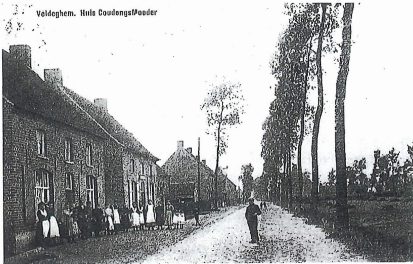
Koning Albertstraat met de populieren uit 1885.

eigen gemeente geen opdrachten kon uitvoeren, was nog niet tot hem doorgedrongen.