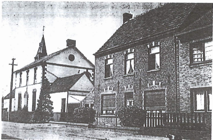
Het schoolhuis in de dertiger jaren. Achter deze witte woning stonden de oorspronkelijke gebouwen van de gemeenteschool (2 klassen).