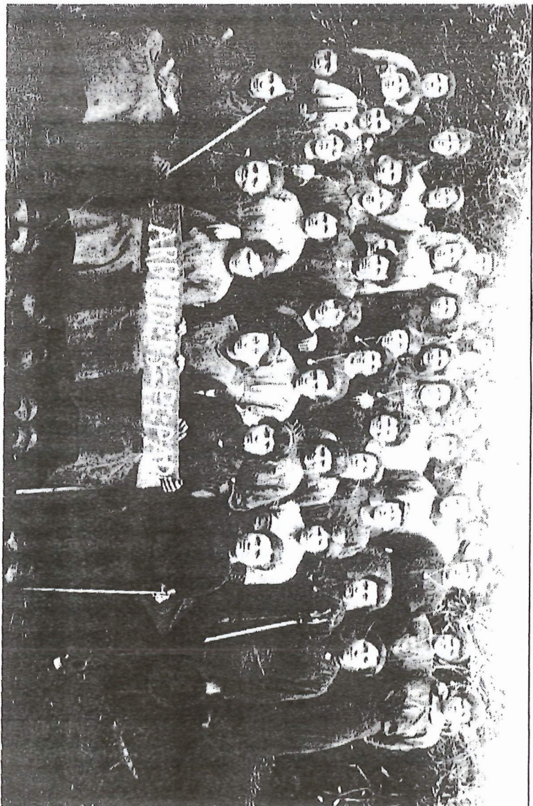
Tewerkgestelden in het pionierspark.