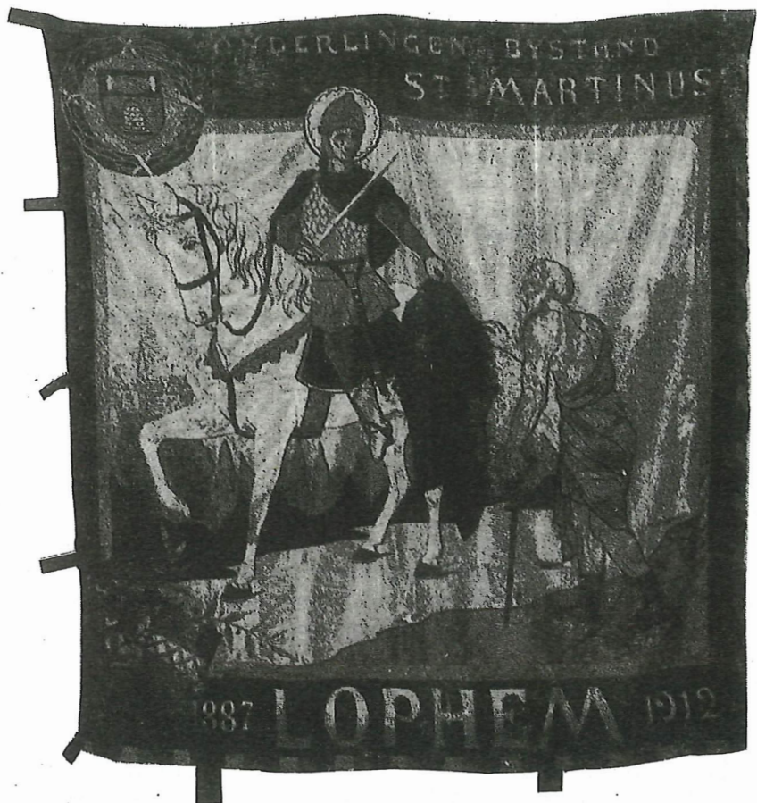
Eerste vlag van de "Gemeenzaamheid St.-Martinus", gewijd in 1912. Merk op dat het stichtingsjaar 1887 niet correct is, maar het verantwoordt wel het zilveren jubileum in 1912.