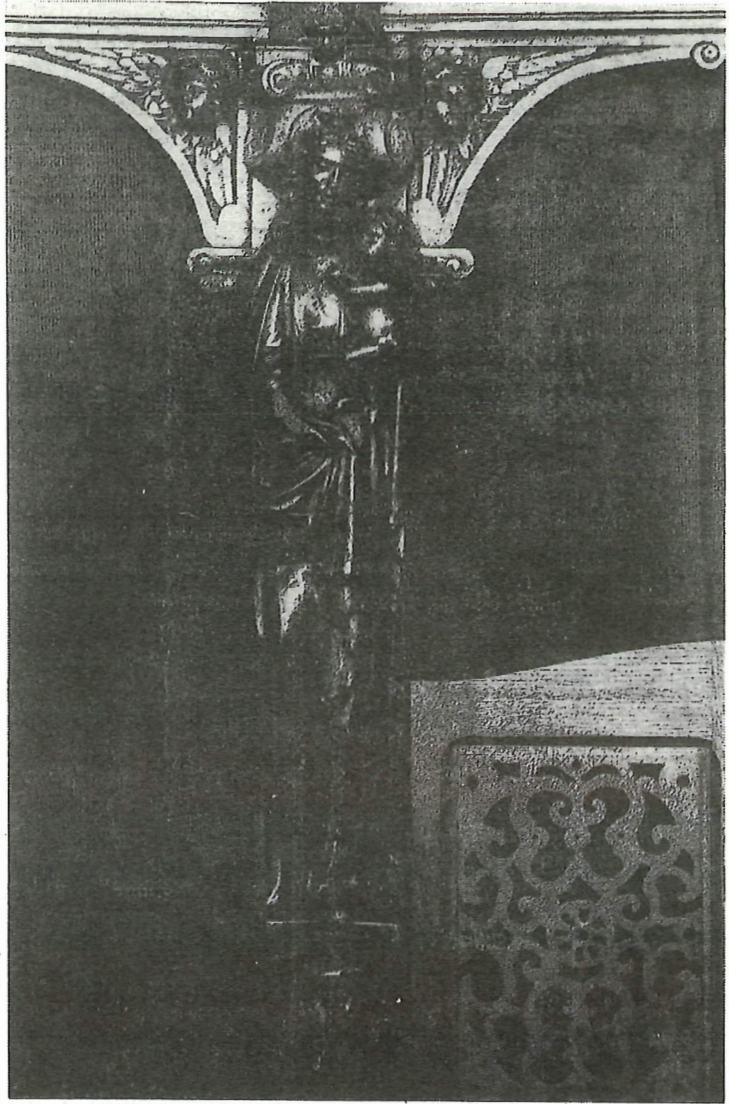
Biechtstoel d.d. 1661 - Detail.